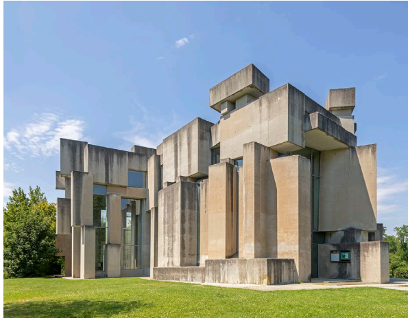
Kirche Zur Heiligsten Dreifaltigkeit auf dem Georgenberg in Wien-Mauer