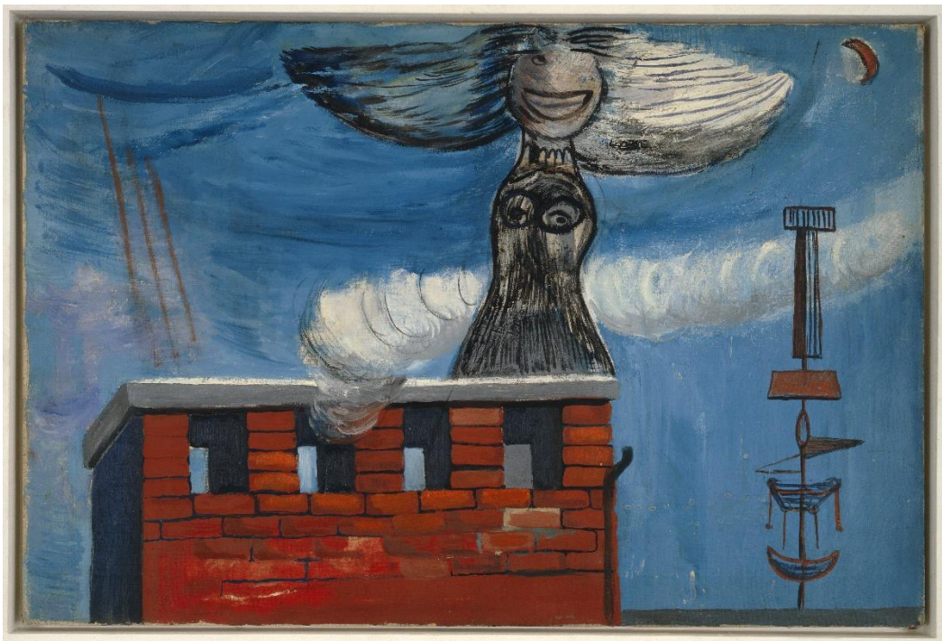
Louise Bourgeois, Roof Song , 1947

Unteres Belvedere 22. September 2023 bis 28. Jänner 2024