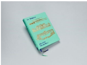
10: Publikation Das Belvedere. 300 Jahre Ort der Kunst