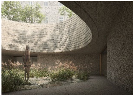
9: Belvedere Salzburg Copyright - Renderings: © Filippo Bolognese Images