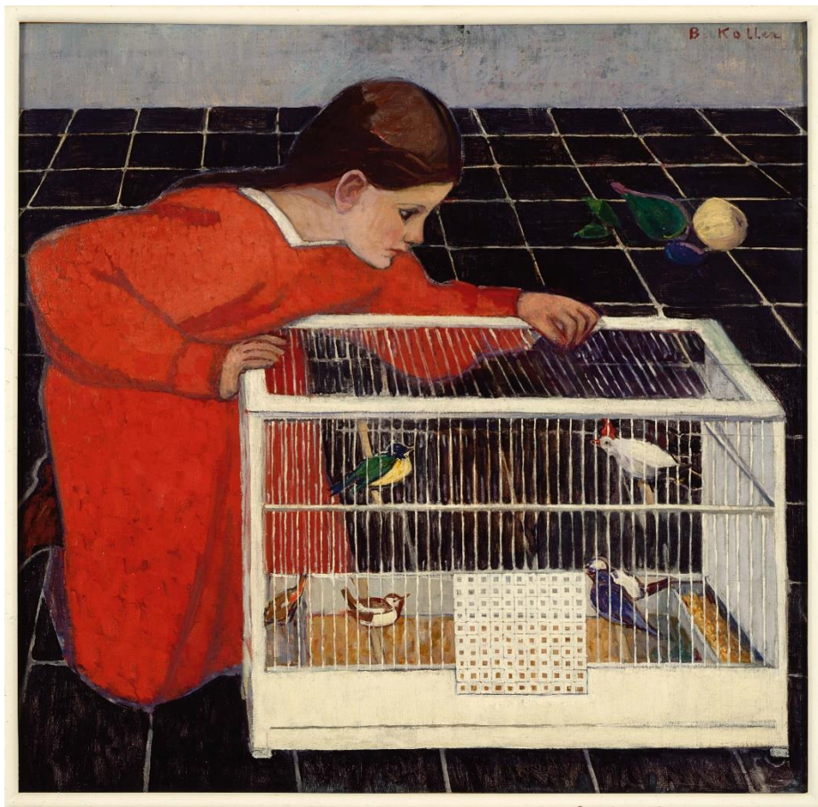
Broncia Koller-Pinell, Silvia Koller mit Vogelkäfig , 1907/08

Unteres Belvedere 15. März bis 8. September 2024