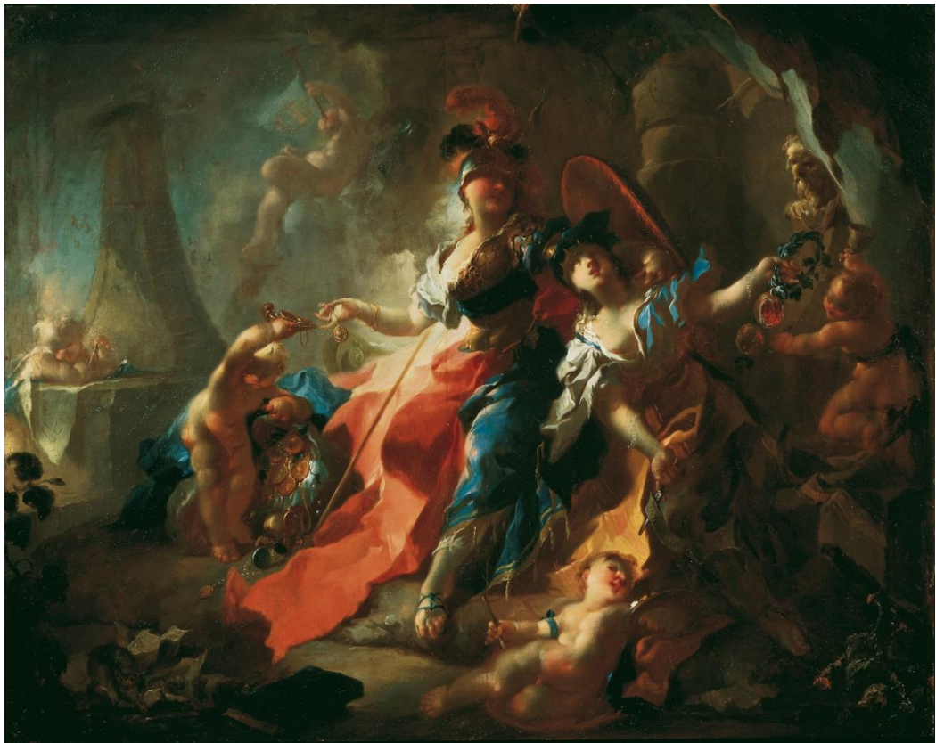
Franz Anton Maulbertsch, Die Akademie mit ihren Attributen zu Füßen Minervas , 1750

Oberes Belvedere 12. April bis 29. September 2024