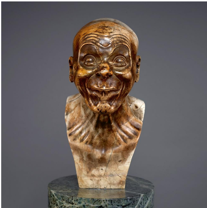
Franz Xaver Messerschmidt, Der Schaafkopf („Charakterkopf" Nr. 17), 1777/83, Belvedere/Wien