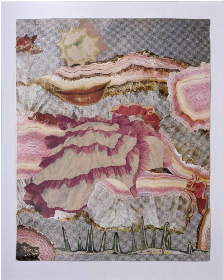
Hannah Höch, Um einen roten Mund , 1967 Diese Arbeit ist Teil der ifa Kunstsammlung.

Unteres Belvedere 21. Juni bis 6. Oktober 2024