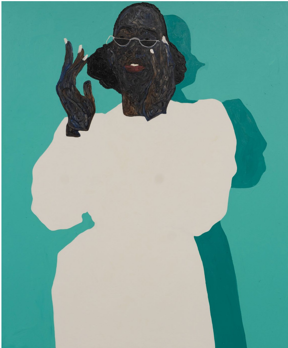
Amoako Boafo, White Nail Polish , 2021 Foto: Roberts Projects © 2024 Amoako Boafo / Licensed by Bildrecht, Vienna

Unteres Belvedere 25. Oktober 2024 bis 12. Jänner 2025