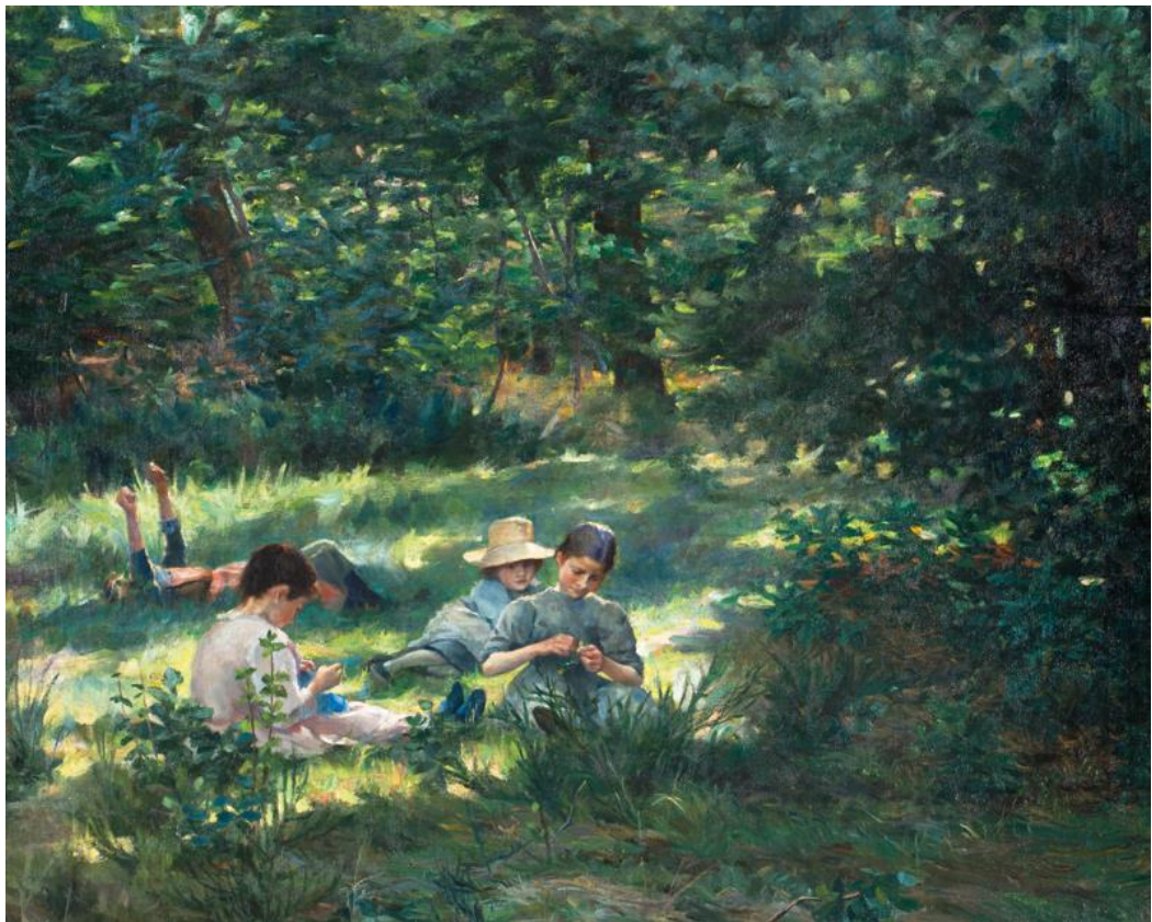
Ivana Kobilca, Kinder im Grünen, 1892 Privatbesitz

Unteres Belvedere 30. Jänner bis 25. Mai 2025