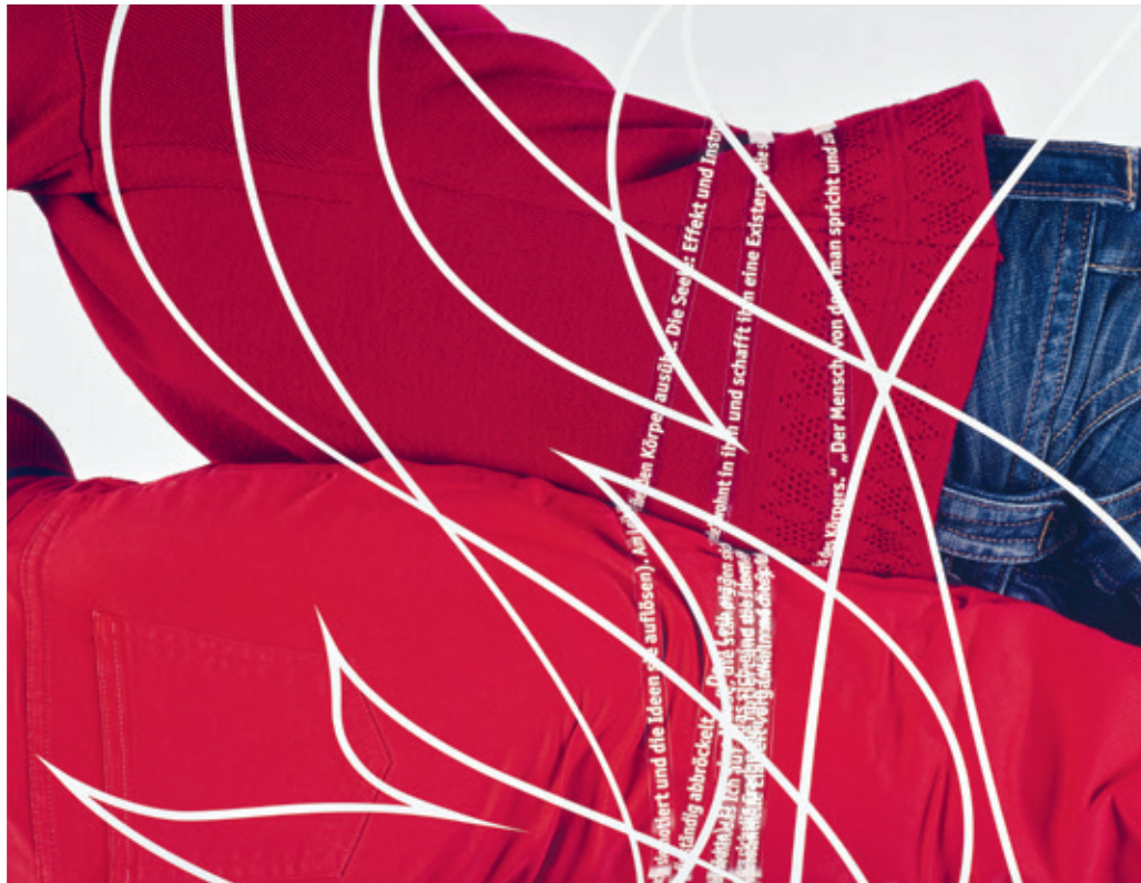
C-Print, digitaler Cut 70 x 90 cm

Maria Hahnenkamps Serie Cut-Out zeigt weibliche Modelle in Alltagskleidung, die sich in fragmentierender Nahaufnahme horizontal über die Bildfläche erstrecken. Einzelnen oder zu zweit aneinandergeschmiegt pressen sie sich gegen eine Glasplatte und werden von unten fotografiert. Die abgeflachten, mit ausgesparten weißen Linien überzogenen Körper erwecken den Eindruck von Einengung – zumal Arme, Beine, Hüfte und Brust von Schriftbändern umschlungen sind. Die Zitate stammen aus Psyche der Macht. Das Subjekt der Unterwerfung der US-amerikanischen Philosophin Judith Butler und verweisen auf Hahnenkamps kontinuierliche Auseinandersetzung mit sozialpolitischer, philosophischer, psychologischer und feministischer Kritik, die sie in ihre künstlerische Arbeit und Bildstrategien übersetzt.