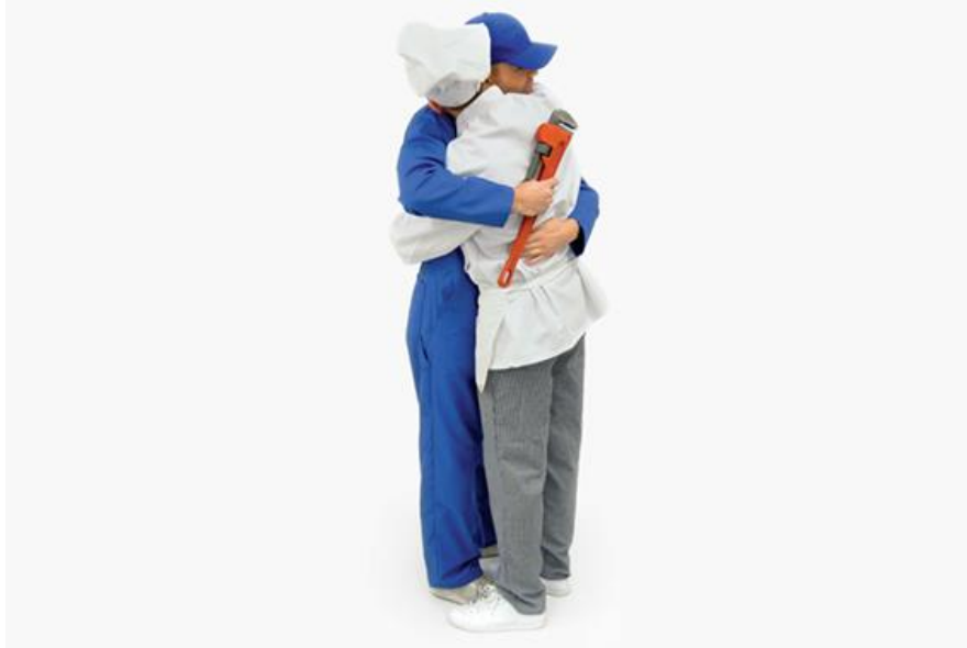
Simon Dybbroe Møller, The Embrace , 2015